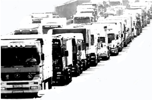
1,9 g Streptomycinsulfat sind in einer 5 Kilometer langen LKW-Kolonne nachweisbar!

Daraus ergibt sich zwangsläufig die Konsequenz, dass ein transparentes Handeln immer notwendiger wird. Transparentes Handeln bedeutet das Erklären und Bewerten von Messwerten, äußerste Disziplin bei Abstands- und sonstigen Auflagen bei Pflanzenschutzmaßnahmen und das Ausschöpfen aller Mittel zur Vermeidung von Fehlern.