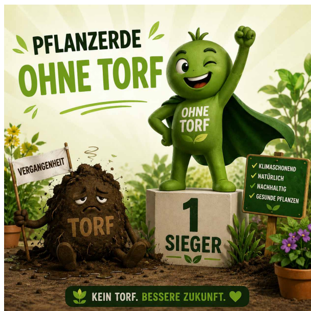
KI generiertes Bild