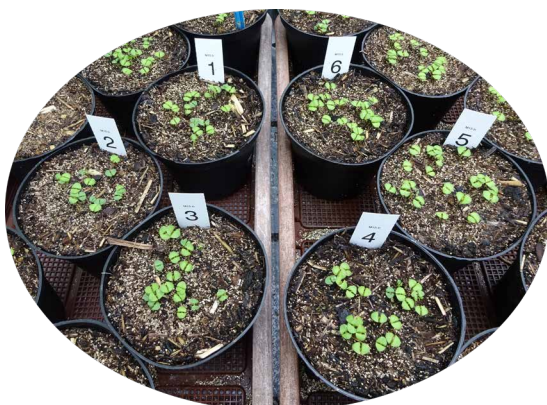
Anbauversuch exemplarisch (Basilikum Frühjahr 2025)

Die wissenschaftliche Begleitung der Versuche erfolgt durch BEST und die BOKU, wobei Parameter wie Wachstum, Ertrag, Nährstoffverfügbarkeit und Substratstabilität erfasst werden.