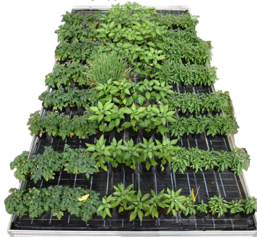
Versuch zur Torfreduktion an Gemüsepflanzen (2020)

Zusätzlich begleiten wir seit ein paar Jahren eine Baumschule bei der Umsetzung im Obstbau und mit Steckholz. Diese Versuche hatten teilweise den Endkunden, wie auch den Jungpflanzenproduzenten als Zielgruppe.