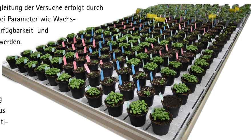
Versuchsüberblick laufender Versuch Frühjahr 2026

Erste Ergebnisse zeigen, dass torfreduzierte und torffreie Substrate zwar eine angepasste Düngung und Bewässerung erfordern, aber durchaus vielversprechende Alternativen darstellen.