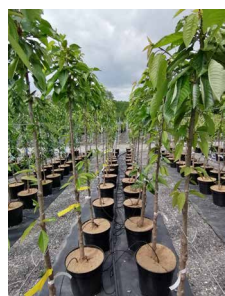
Versuch zur Torfreduktion an Obstgehölzen in der Baumschule (ab 2023 laufend)

In Hinblick darauf wurde in den letzten Jahren vermehrt der Fokus von den Sortensichtungen bei Beet- und Balkonpflanzen auf die klimarelevante Thematik von Torfreduktion zur Torffreiheit gelegt. Nicht alle Länder verfolgen hier die gleiche Strategie: während in manchen unserer Nachbarländer ein strikter Pfad zur Reduktion eingehalten werden muss, zeigen andere Nationen ein deutlich geringeres Engagement. In jedem Fall lohnt es sich, für die Praktiker Erfahrungen auf diesem Gebiet zu sammeln.