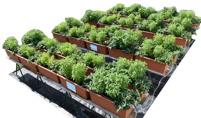
Torffreie Substrate im Balkonkisterl für den Endkunden (2021–2023)