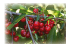
...und Starking Hardy Giant.