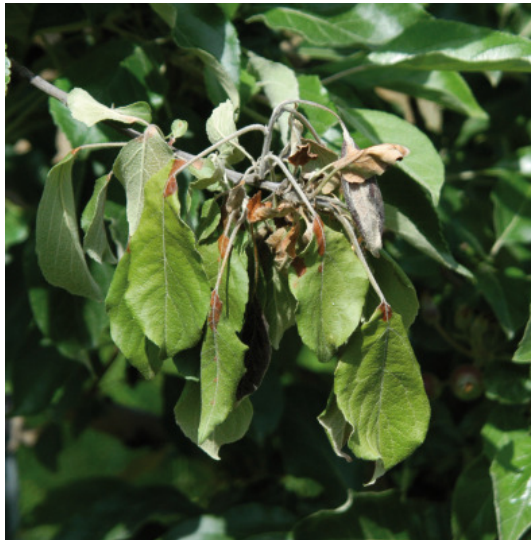
Typische Symptome einer Blüteninfektion.

In der Oststeiermark ist der Feuerbrand zwar auch flächendeckend aufgetreten, die Befallsstärke scheint hier aber noch nicht so stark zu sein wie im Westen unseres Landes. Nur relativ wenig Befall gab es im Süden der Steiermark.