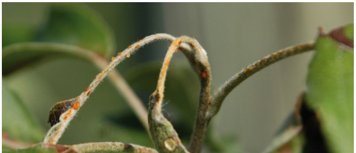
Massive Bildung von Schleimtropfen am Apfeltrieb.