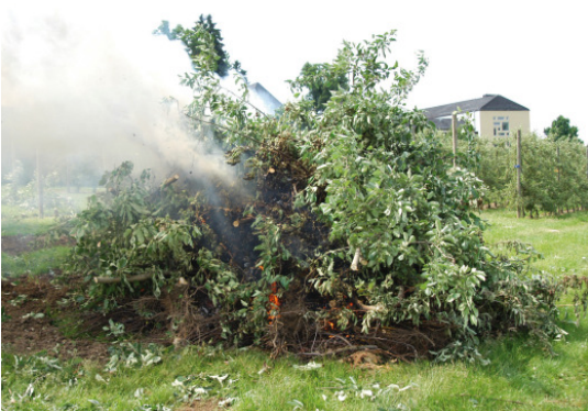
Rodung der Jonathan-Anlage im Mehltau-Pflanzenschutzquartier.

Aufgrund des hohen Risikos, dass der Feuerbrand auf die Sortenprüfungsquartiere übergreift und die mehrjährige Prüfung neuer Sorten gefährden könnte, wurden beide Anlagen gerodet.