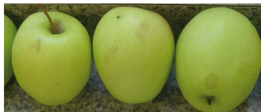
Die Sorte Golden Delicious ist extrem anfällig für Druckstellen.