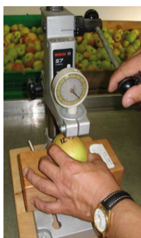
Mit dem Penetrometer werden gezielt Druckstellen am Apfel induziert.

Druckstellen sind vielfach ein Hauptproblem bei der Belieferung von Premium-Märkten und mit ein Grund für oft sehr teure Reklamationen. Obwohl alle Apfelsorten mehr oder weniger zu Druckstellen neigen, zeigt Golden Delicious – im Vergleich zu anderen Sorten – eine höhere Anfälligkeit.