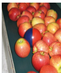
Der elektronische Apfel dient der Überprüfung von Sortiermaschinen.

Fachliche Betreuung (Beratung) der Lagerhalter (gem. mit OPST)