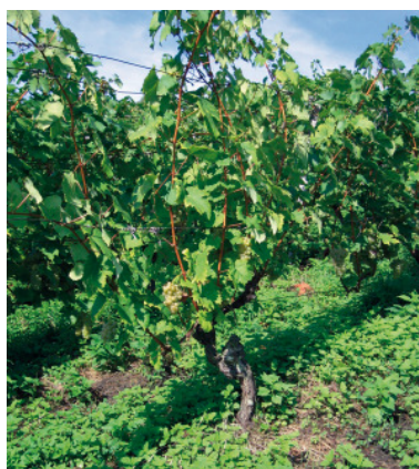
Ausgangsstock aus einem alten Ertragsweingarten.

Bei einigen önologisch interessanten Selektionen wurden bei den serologischen Tests Viren festgestellt, die nur latent vorhanden sind aber weder in den ursprünglichen alten Ertragsweingärten noch im Laufe der jahrelangen Prüfungen am Versuchstandort Viruserkrankungen hervorgerufen haben.