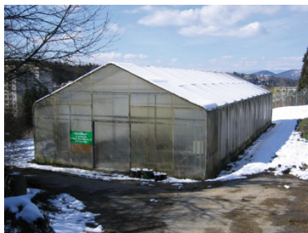
Die Konservierung des virusfreien Elitepflanzmaterials erfolgt im Saranhaus des Landesversuchszentrums in Haidegg...