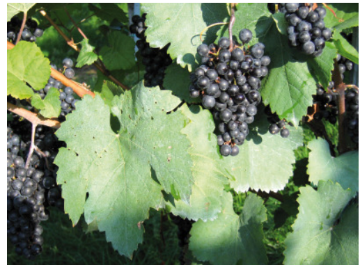
Klon der Blauen Wildbacherrebe: Haidegger Klon 23.

Im amtlichen Anerkennungsverfahren sind derzeit 9 weitere Haidegger Klone der Sorten Welschriesling, Sauvignon, Morillon, Muskateller, Traminer, Weißburgunder und Sankt Laurent.