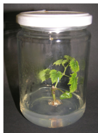
... und in vitro als Meristemkultur.

Die Haidegger Klone werden in den folgenden Ausgaben der Haidegger Perspektiven detailliert beschrieben und vorgestellt.