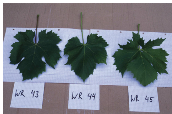
Eine Sorte - drei deutlich unterschiedliche Klone.

Die Haidegger Klone werden in den folgenden Ausgaben der Haidegger Perspektiven detailliert beschrieben und vorgestellt.