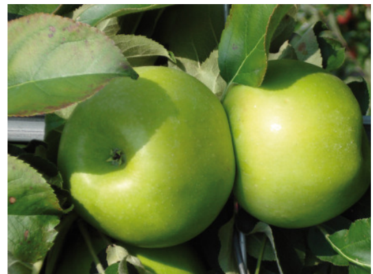
Erste Früchte der Sorte Greencats.