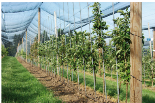
Bei säulenförmig wachsenden Apfelbäumen sind deutlich geringere Pflanzabstände und Reihenabstände möglich.

Das erhöht auf der einen Seite natürlich die Investitionskosten (höhere Baumzahl/ha), auf der anderen Seite aber auch die potentiellen Hektarerträge. Ein weiterer Vorteil ist die maschinelle Bearbeitungsmöglichkeit. Sowohl Schnitt als auch Ernte könnten mit Hilfe von Maschinen durchgeführt werden.