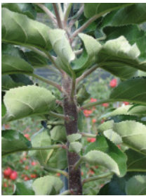
Das säulenförmige Wachstum entsteht durch stark verkürzte Internodien.

Bereits 1960 wurde in Kanada von einem Obstbauern eine Mutante der Sorte McIntosh gefunden, die den charakteristischen Säulenwuchs zeigte.