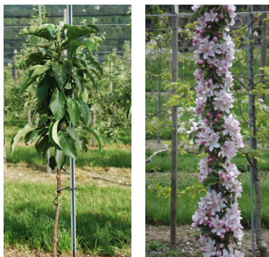
Die Sorte Lancelot im Pflanzjahr (links) und Ginover in Vollblüte (rechts).

Im Jahr 2009 war bei fast allen Sorten mit Säulenwuchs ein guter Ertrag feststellbar. Laut Aussagen von anderen Sortenprüfern neigen diese Sorten stark zu Alternanz.