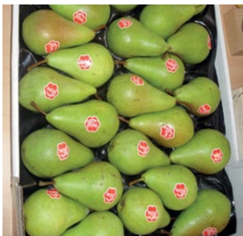
Die Birnensorte Cepuna wird unter der Marke Migo ® derzeit hauptsächlich in Holland und Belgien verkauft.