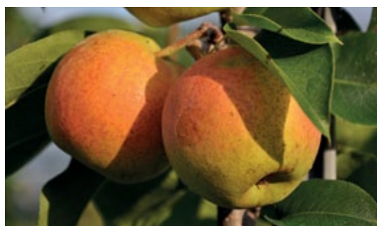
Auch neuere Fruchtformen wie bei der Sorte Reddy Robin stehen in der Sortenprüfung in Haidegg. Dabei handelt es sich um eine Kreuzungen von asiatischen Birnensorten.

Das Prüfquartier wurde im Frühjahr 2012 angelegt, d.h. die ältesten Bäume stehen im fünften Laub. Als Referenzsorten wurden Bosc's Flaschenbirne und Novemberbirne gepflanzt. In den nächsten beiden Jahren sollen noch Williams Christbirne, Conference und Abbate Fetel dazukommen.