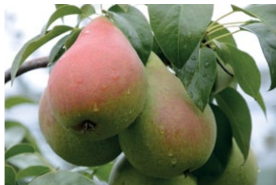
Pear 1 könnte als spätreifende Sorte das Birnensortiment in der Steiermark bereichern.

Diese spät reifende Birnensorte entstammt dem Züchtungsprogramm von Sempra Praha aus Tschechien und wurde aus den beiden Elternsorten Conference x Forellenbirne gekreuzt. Die Früchte sind in der Haidegger Sortenprüfung aufgrund der sehr guten Geschmacks- und Lagereigenschaften unter Kühlagerbedingungen aufgefallen. Die Zweifarbigkeit ist allerdings nur an den besonders gut besonnenen Früchten schön ausgeprägt. Es ist geplant, diese Sorte in der zweiten Prüfstufe mit etwa 100 Bäumen weiter und genauer zu beobachten.