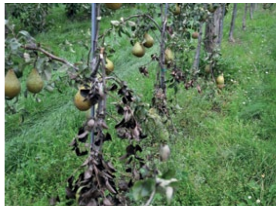
Probleme, die schon in der ersten Prüfstufe bei der Prüfung von neuen Birnensorten auffallen, wie hier z.B. abgebrochene Äste bei Jungbäumen der Sorte Novemberbirne. Durch das hohe Fruchtgewicht ziehen die Früchte die Äste nach unten, im Extremfall brechen diese vollständig ab.