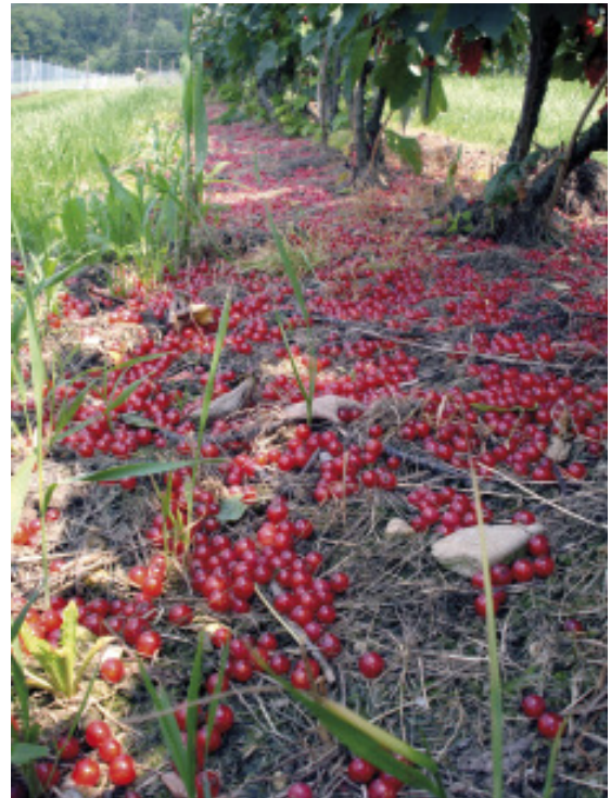
Eine zu hohe Konzentration von Ethephon führt auch bei Ribiseln zu vorzeitigem Fruchtfall.

Das heißt, die Beeren lagern so gut wie keinen Zucker mehr ein, bleiben dadurch extrem sauer, und legen auch nicht mehr an Größe zu. Gerade im unteren Bereich der Traube nehmen die Beeren bis vor der Ernte stark an Gewicht zu (siehe Diagramm). Bei Rovada wurden im Vorjahr durch kleingebliene Beeren Erntegewichtseinbußen von mehr als 15 % festgestellt. Zu hohe Konzentrationen vor der Ernte fördern massiv die Ausbildung eines Trenngewebes zwischen Frucht und Fruchtstiel und können bei hohen Temperaturen zu vorzeitigem Fruchtfall führen.