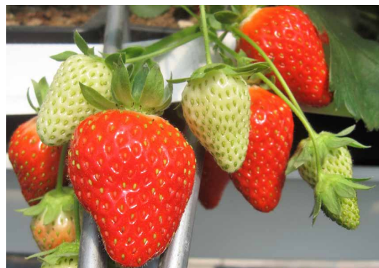
Murano ist aktuell die Hauptsorte bei den Remontierern.

Den höchsten Anteil Früchte der Handelsklasse I > 25 mm hatten ebenfalls die Sorten Florentina (ca. 800 g/Pflanze), 08-06-10 und Malga mit je ca. 760 g/Pflanze (Abb. 2). Malga und 08-06-10 haben mit knapp über 85 % auch den höchsten Prozentanteil marktfähiger Früchte. Bei Charlotte war der Anteil an Krüppelfrüchten in diesem Versuch mit über 15% am höchsten (Tab. 1), der niedrigste Anteil deformierter Früchte war bei der Zuchtnummer 08-06-10 zu beobachten. Mit einem durchschnittlichen Fruchtgewicht von ca. 12 Gramm konnten die absolut größten Früchte in diesem Versuch bei der Sorte Florentina geerntet werden. Die Früchte bei Charlotte sind im Durchschnitt um 3 g kleiner als die von Florentina.