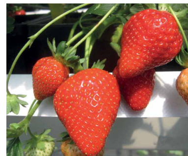
Florentina - eine neue und interessante remontierende Erdbeersorte.

Bei der Gesamtbeurteilung der 2016 in Silberberg geprüften remontierenden Erdbeersorten schnitten unter Berücksichtigung der wichtigsten Ertrags- und Qualitätsfaktoren die Sorten Murano und Charlotte am besten ab. Im Folgeversuch 2017 wurden dann neue Sorten, die eine höhere Thripse-Toleranz aufweisen sollen, mit ins Versuchsprogramm aufgenommen und mit den beiden Sortensiegern des vorangegangenen Versuchsjahres verglichen.