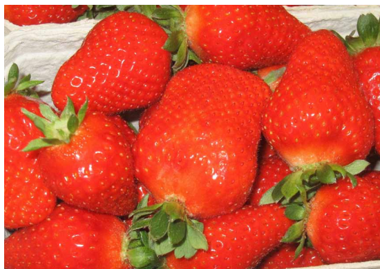
Die Sorte Malga zeichnet sich durch hohe Erträge und einen hohen Prozentanteil marktfähiger Früchte aus.

Die höchsten Gesamterträge in diesem Versuch lieferten die Sorten Florentina mit 7,2 kg/lfm (davon 5,8 kg/lfm vermarktungsfähig) und die Nummernsorte 08-06-10 mit 7,0 kg/lfm (5,9 kg/lfm vermarktungsfähig). Malga folgt dann knapp dahinter mit einem Gesamtertrag von 6,6 kg/lfm (5,5 kg/lfm vermarktungsfähig). Die Vergleichssorten Murano und Charlotte liegen mit Ertragswerten von knapp 5 kg doch etwa 2 kg hinter den neu im Versuchsprogramm getesteten Sorten zurück. In der Literatur wird für remontierende Erdbeersorten ein Ertrag zwischen 6 – 8 kg/lfm als Richtwert für das Optimum formuliert. Das würde bei den im Folientunnel gewählten Pflanzweiten einem ha-Ertrag zwischen 40 bis 60 t entsprechen. Entscheidend für die Wertbeurteilung ist jedoch nicht allein der Gesamtertrag, sondern der Anteil marktfähiger und großfrüchtiger Ware (25 +) am Gesamtertrag. Dieser Wert ist auch maßgeblich für die Pflückleistung.