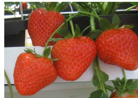
Die Zuchtnummersorte 08-06-10 bedarf noch einer weiteren Prüfung.

beiden Spitzenreiter des im Vorversuches im Jahre 2016 Murano und Charlotte wurden von den neu im Versuchsprogramm geprüften Sorten deutlich überflügelt. Ein versuchsweiser Anbau von Malga und Florentina kann durchaus empfohlen werden; die Nummersorte 08-06-10 bedarf noch einer weiteren Prüfung.