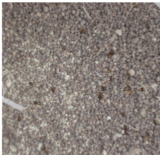
Im Versuch wurden Mykorrhiza-Pilze im Produkt „Symbivit“ eingesetzt. Symbivit wird in 20 kg-Säcken angeboten. Der Blick in den Sack zeigt die granuliert Form des Mykorrhiza-Produktes.

Im Versuch wurde das Produkt „Symbivit“ verwendet. Dabei handelt es sich um eine granuliert Formulierung von Pilzsporen und –mycel, Blähton, Tonmineralien, Humate, Chitin, Alginate, Keratin und Rohphosphat, die einfach auf das Pflanzloch aufgestreut werden. Im Produkt sind sechs verschiedene Stämme der Gattung Glomus sp. formuliert.