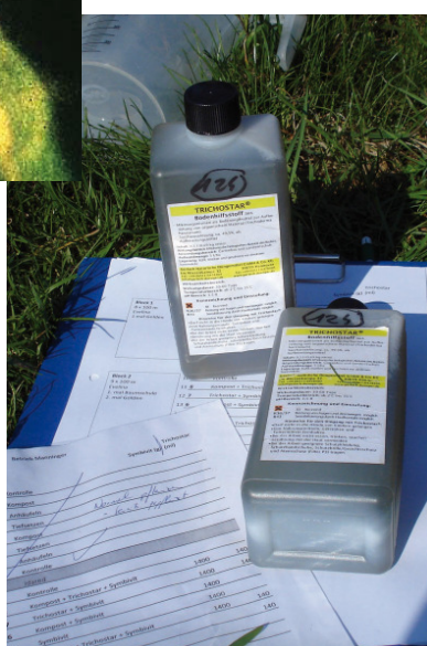
Im Versuch wurde die flüssige Formulierung „Trichostar“ eingesetzt. Das Produkt wird in Gießwasser verdünnt direkt auf das Pflanzloch gegossen.