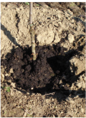
Ein gezielter Austausch des Bodens mit Kompost kann die Pflanze in den ersten Jahren im Wachstum stärken.

Die Themen „Bodenmüdigkeit“ und „Nachbauprobleme“ nehmen immer breiteren Raum bei diversen Diskussionen um Ertragsleistung und Wachstum von Pflanzen ein. Bei Steinobst ist das Problem bei Nachpflanzung derselben Kultur auf dem gleichen Standort bekannt, bei Kernobst zeichnen sich die ersten Probleme bereits ab.