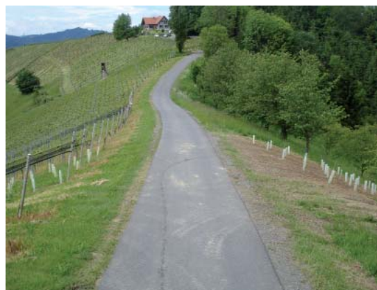
Pilotversuch in unserer Außenstelle in Glanz. Die günstige Topographie erlaubt es, einen direkten Vergleich zwischen Nord- und Südhang zu stellen.

Beobachtet werden außerdem die Unterschiede in der Phänologie, die Traubenqualität, die Weinqualität und Typizität sowie die Empfindlichkeit gegen Schädlinge und Frost. Erste genaue Bonitierungen werden mit dem Vegetationsjahr 2015 beginnen.