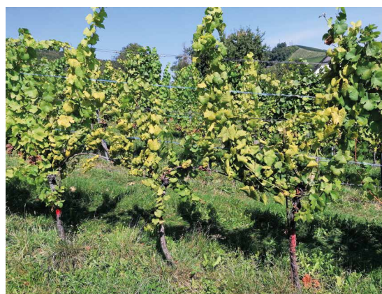
Abb. 1: GFD-positiv getesteter Rebstock. (Foto: DI Martin Klug, A10).

Bei einzelnen Rebflächen waren mehr als 20 % symptomtragende Pflanzen vorhanden, sodass nur mehr die Rodung der gesamten Anlage oder von Anlagenteilen im erforderlichen Ausmaß in Frage kam.