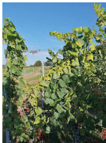
Abb. 2: Symptome der Goldgelben Vergilbung. (Foto: DI Martin Klug, A10).