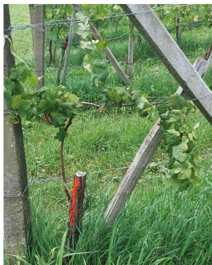
Abb. 4: In der Vergangenheit positiv getesteter und rückschnittener Weinstock..

Da sich die Situation rund um die ARZ und GFD in den Weinbaugebieten zunehmend verschlechtert, sind die Weinbaubetriebe angehalten, Maßnahmen