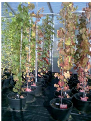
Konservierung der gesunden Klone im Saranhaus

Mit Herbst 2010 wurden die Rebsortenklassifizierungen (Zulassung zum Anbau) in den Weinbau treibenden Bundesländern Österreichs, unter Zuhilfenahme des Wissens aus den Versuchen der Versuchsstation Haidegg, um zahlreiche Sorten aus der Gruppe der pilzwiderstandsfähigen Rebsorten erweitert. Zusätzlich wurde mit der Rebsortenverordnung BGBl. II Nr. 161/2010 die Möglichkeit geschaffen, sieben Rebsorten als „Wein ohne geschützte Ursprungsbezeichnung oder geografische Angabe mit Sorten- oder Jahrgangsbezeichnung“ in Verkehr zu bringen („Rebsortenwein“).