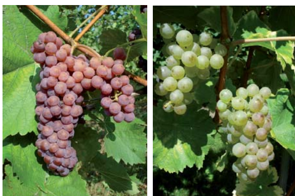
Links: Vielversprechende pilzwiderstandsfähige Rebsorte „Souvignier gris“ rechts: Sauvignon blanc Haidegg 13

Super-Standard-Klon gezüchtet werden, sondern werden viele verschiedene Elite-Typen gezüchtet. So wurden aus der Steiermark bislang 31 gebietstypische Klone (22 aus Haidegg und 9 aus dem Projekt des Vereines österreichischer Rebveredler) amtlich anerkannt und zum Verkehr als zertifiziertes Pflanzgut zugelassen.