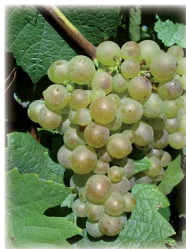
Weißburgunder Haidegg 31

Die aktuelle Generation bringt hingegen einige sehr interessante und für die Zukunft viel versprechende Beispiele pilzfester Rebsorten hervor! Momentan werden in der Außenstelle Glanz 23 derartige Rebsorten geprüft. Neben wenigen Rotweinsorten werden hauptsächlich Weißweinsorten den Beobachtungen unterzogen. Ein Ziel der Untersuchungen ist die Prüfung der Empfindlichkeit der Blätter und Trauben gegenüber echtem und falschem Mehltau sowie Traubenfäulnis (Botrytis). Weiters werden die Erntedaten gesammelt und die Weine einem Versuchsweinausbau, teilweise im Rahmen der Mikrovinifikation, unterzogen.