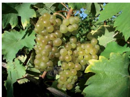
Welschriesling Haidegg 4