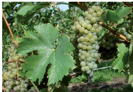
Bronner - Eine etablierte pilzwiderstandsfähige Rebsorte

Biodiversität oder biologische Vielfalt bezeichnet gemäß der Biodiversitäts-Konvention (Convention on Biological Diversity, CBD) „die Variabilität unter lebenden Organismen jeglicher Herkunft, darunter unter anderem Land-, Meeres- und sonstige aquatische Ökosysteme und die ökologischen Komplexe, zu denen sie gehören; dies umfasst die Vielfalt innerhalb der Arten und zwischen den Arten und die Vielfalt der Ökosysteme“. Nach dieser Definition besteht die Biodiversität neben der Artenvielfalt auch aus der genetischen Vielfalt und der Vielfalt von Ökosystemen. Die Reichweite der Biodiversität schließt daher alle Aspekte der Vielfalt in der lebendigen Welt ein. Quelle: Wikipedia