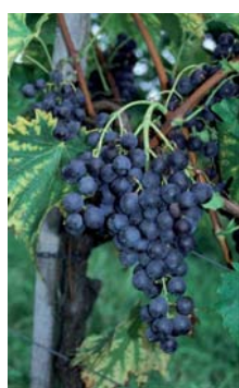
Widerstandsfähige Speisetraube „Muskat bleu“

Rebenpflanzgut im modernen Weinbau unterliegt den gesetzlichen Anforderungen der europäischen und nationalen Gesetzgebungen sowie den praktischen Bedürfnissen der praktizierenden Winzer. Somit sind die wichtigsten Attribute für Pflanzgut auf jeden Fall: GESUND, SORTENREIN, STABIL, TYPISCH. Vor diesem Hintergrund laufen die Tätigkeiten der Versuchsstation Haidegg in den Bereichen Klonenselektion, Klonenprüfung und Sortenprüfung.