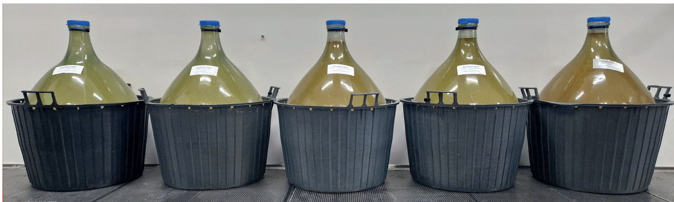
Abbildung 1: v.l.n.r Reduktiv, Normal, F-Maische, F-Most und Oxidativ

Wochen erfolgte eine Schichtenfiltration. Anfang Februar 2025 erfolgte eine weitere SO 2 Korrektur von rund 10 mg/l und die Abfüllung der Varianten.