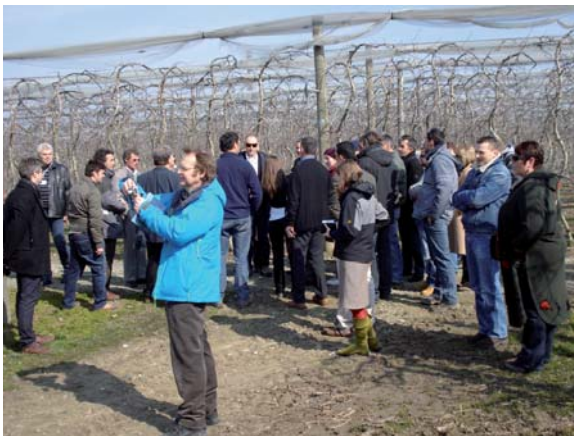
Eine kurze Führung durch Obstanlagen gibt am Rand des Expertentreffens einen Einblick in die Kulturführung der Region Piemont.

Neben dem fachlichen Austausch gab es auch eine kurze Führung, um einen Überblick über den Obstbau in der Region zu bekommen.