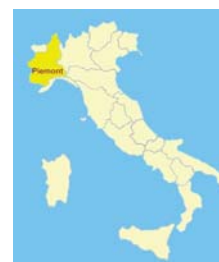
Im heurigen Frühjahr fand das Treffen von Sortenprüfern und Züchtern bzw. Lizenzinhabern im Piemont statt.