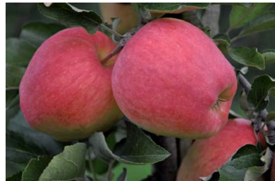
Die Clubsorte Ambrosia wird in der Region Piemont angebaut.

Mit jeweils ca. 5.000 ha werden im Piemont Äpfel, Pfirsiche und Kiwis angebaut. Die Hauptsorten beim Apfel sind Red Delicious, Golden Delicious und Gala. Eine Besonderheit der Region ist der Anbau der Clubsorte Ambrosia®.