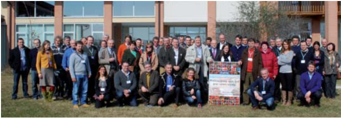
Erstmals waren beim Treffen der Sortenprüfer auch Züchter und Lizenzinhaber von neuen Kernobstsorten eingeladen.

Neben dem fachlichen Austausch gab es auch eine kurze Führung, um einen Überblick über den Obstbau in der Region zu bekommen.