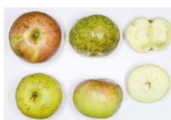
Grüner Stettiner € 3,00 - € 5,00