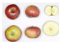
Haslinger € 3,00 - € 5,00