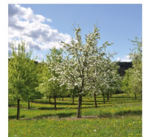
Edelreiser historischer Kernobstsorten