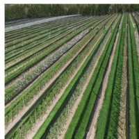
Edles aus den Obstgärten