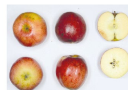
Lavanttaler Bananenapfel € 3,00 - € 5,00