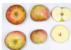
Harberts Renette € 4,00 - € 5,00