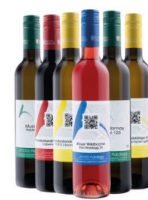
Versuchspakete zum Ausprobieren