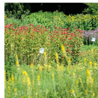
Edles aus dem Garten