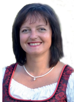
Layout: Karolina Spandl

Für das Layout und die kreative Gestaltung der Haidegger Perspektiven ist unsere gute Seele Karolina Spandl verantwortlich. Sie schafft es jedes Mal aufs Neue, die (meist viel zu langen) Artikel der Redakteure mit den passenden Fotos auf optisch an-