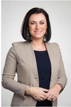
Elisabeth Köstinger Bundesministerin

Nachhaltige Waldbewirtschaftung und deren konsequente Umsetzung ist Grundlage unseres heutigen Waldreichtums in Österreich. Das Konzept Nachhaltigkeit wurde von Menschen entwickelt, die den Wald erhalten wollten. Es kann in Mitteleuropa auf eine 300-jährige Geschichte zurückblicken.