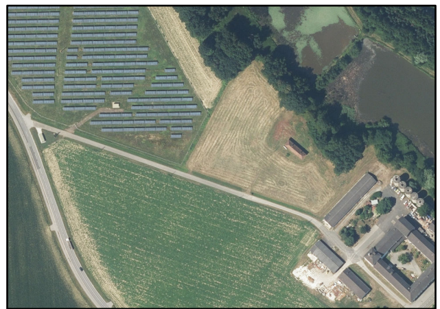
Plangrundlage Orthofoto 1:5.000

Orthofoto / Datengrundlage: GIS Steiermark 12/2022